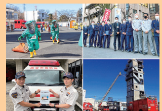
■ 表紙 本号掲載記事より