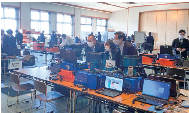
配信基地局の様子

「全国メディカルコントロール協議会連絡会」は、全国のメディカルコントロール協議会に關係する機関（救急医療に關係する学会、団体、消防機関及び医療機関等）がメディカルコントロール体制に關する課題を整理するとともに、他のメディカルコントロール協議会等から学ぶことができるよう情報共有及び提言の場として行っているもので、平成19年度の初開催以来、今年度で14年目となります。