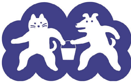
防災まちづくり大賞シンボルマーク

災害による被害を軽減するためには、地域の防災力を強化すること、とりわけ地域の方々の「自分たちの地域は自分たちで守る」という強い意識と連帯感に支えられた自主的な防災活動を推進していただくことが重要です。